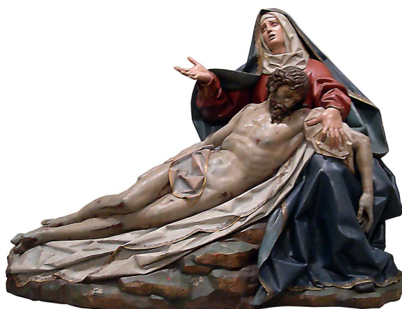
Piedad (Gregorio Fernández)

Martínez Montañés (1568-1649). Máximo representante de la escuela sevillana de imaginería, trabajó obras renacentistas y barrocas. Entre su amplia obra destaca: San Jerónimo (1597), San Bruno, San Ignacio de Loyola, San Juan Bautista, San Cristóbal o Niño Jesús.